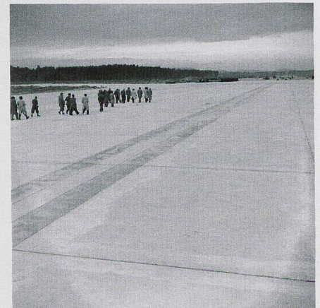
Inspecting run way, 1948