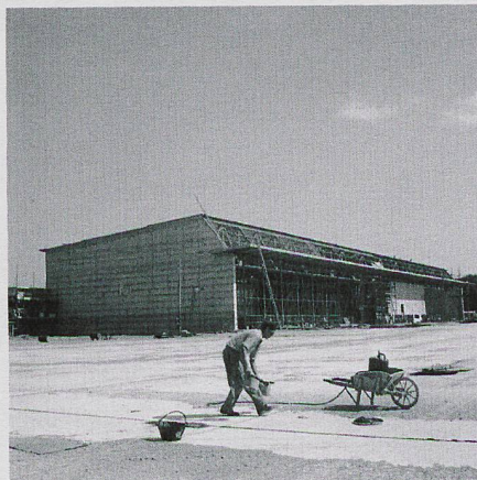
First terminal being built, 1947