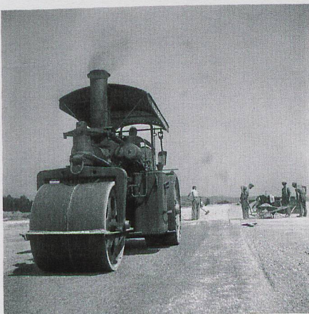
Steam rolling run way, 1947