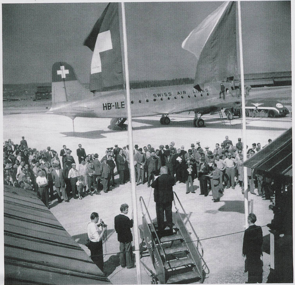
Official inauguration, 1948