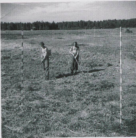
Searching for potential unexploded shells, 1946