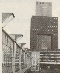
Das Torhaus in Frankfurt; links das Personenbeförderungssystem «Via Mobile».

25.10. Messehochhaus, Frankfurt am Main – Bau-Monographie von Oswald Mathias Ungers. Die Ausstellung ist bis zum 19. November im Architekturforum Zürich zu sehen.