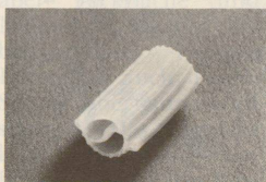
«Mandala» von Philippe Starck.