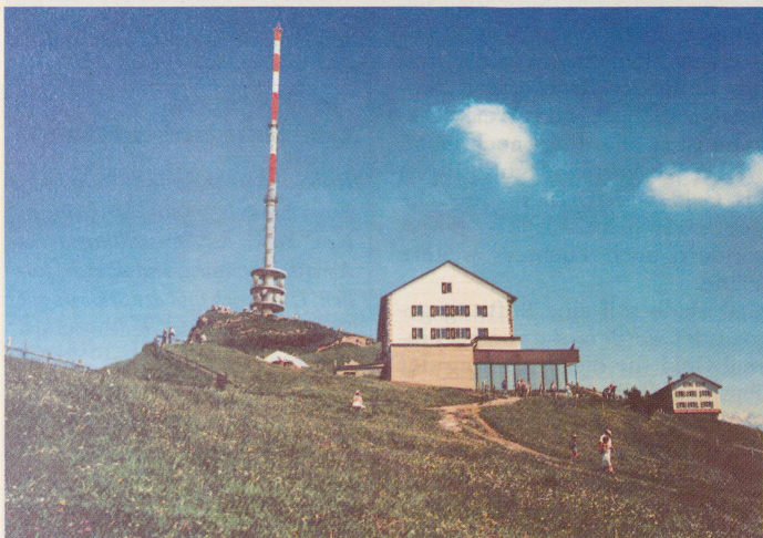
Der bestehende Antennenturm auf Rigi-Kulm (oben) ist 50 Meter hoch. Der Nachfolger soll nicht nur mehr als doppelt so hoch werden, sondern auch mit riesigen Parabolspiegeln bestückt sein (unten).

Ein Antennenturm auf Rigi-Kulm durchlöchert schon seit bald 30 Jahren das vielzitierte Ideal der «freien Rigi». Nun planen die PTT jedoch als Neubau ein doppelt so hohes, massives, rot-weiss geringeltes Monstrum.