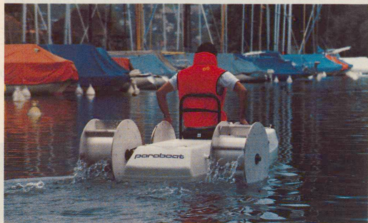
Vom Rollstuhl ohne Probleme aufs Wasser: das Paraboat für Paraplegiker.