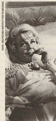
«Bettgeflüster» per Telefon mit Doris Day; mehr auf Seite 36.