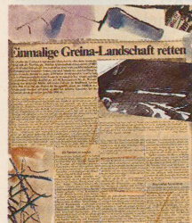
Einmalige Greina-Landschaft retten Landschaftsschutz als Kunst: Illustrationen von Bryan C. Thurston. Seite 56