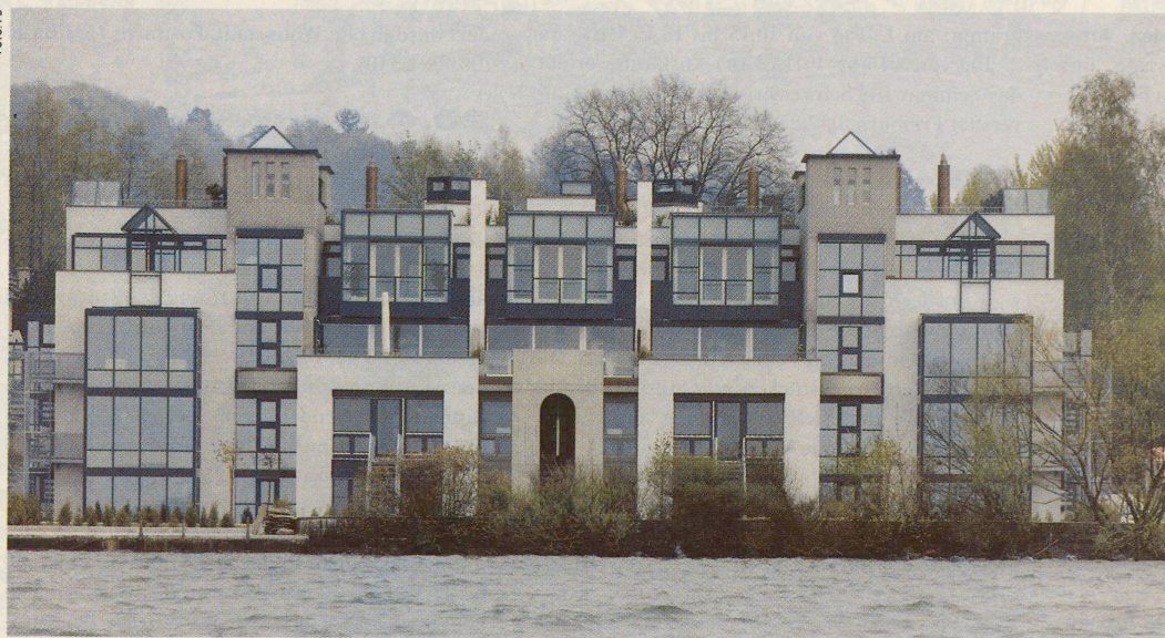
Ein Hauch von Kalifornien am oberen Zürichsee: Die «Residenz Seebucht» in Rapperswil von Architekt Giuseppe Guizzetti.