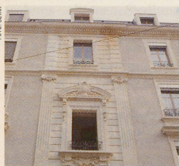
Das sanft renovierte Quartier des Grottes in Genf. Seite 78