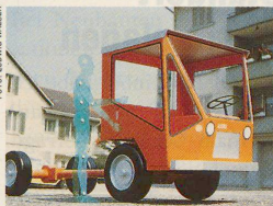
Der Aebi-Transporter, gelbe Version: ein Produkt des Gestalters Ludwig Walser. Seite 36