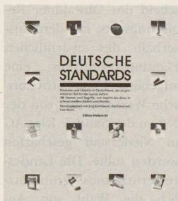
Jörg Kirchbaum (Hg.): «Deutsche Standards», Edition Weitbrecht, 1988, Fr. 45.10

Wenn ein Produkt, eine Sache zum Standard wird und so gleichsam ein Allgemeingut, so ist etwas Wunderliches passiert. Ein Kapital kann sich ausruhen auf den Lorbeeren. Die Verkäufe realisieren sich von selbst. Beispiele: VW Käfer, Klosterfrau Melisengeist, Melitta-Filtertüten, Maggi-Suppe, Nivea-Creme. Die technische Entwicklung beschert uns ja hin und wieder bessere Produkte, als es Standards sind – das alles nützt nichts: Wir halten uns an ihnen fest – einmal geschenktes Vertrauen gilt für lange Zeit. Für hundert deutsche Standards ist diese Geschichte jetzt aufgezeichnet. Allerdings: Geschichte ist hoch gegriffen. Von Geschichte erwarten wir ja Erklärung und kritische Deutung. Was vorliegt, sind eher Anekdoten und Materialien, wie sich die Einzelkapitalien im Dickicht der Märkte durchgesetzt haben. Dieses Exerzitienbuch der Konsumgesellschaft ist einfach und klar gestaltet. Die Standards sind alle in standardisierter Form fotografiert. Übrigens: Unser guter Julius Maggi gehört ebenso wie die Krokodil-Gotthard-Lokomotive und die Lindt-Schokolade zu den deutschen Standards. GA