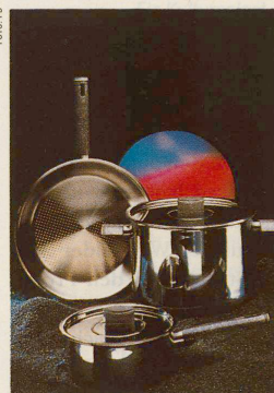
Kreationen von Daniel Lori: Bankfassade in Zürich; Kugelbehälter für Firmenprodukte als Geschenk für den Seniorchef; Hitzeschutzeinsätze und Metallglanz für Pfannengriffe.