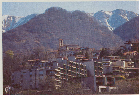
Zweitwohnungsresidenz Cadrolina: widersprüchliche Planungspolitik.

Die deutschsprachige «Tessiner Zeitung» zeigte kürzlich auf, wohin die unaufhörliche «touristische Entwicklungshilfe» im Tessin führt: In Orselina und Brione oberhalb Minusio beträgt der Zweitwohnungsanteil 60 Prozent.