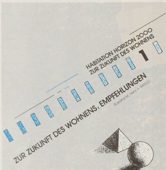
ETH-Forschungsbericht: Schlussfolgerungen von dünner Konsistenz.

«Zur Zukunft des Wohnens: Empfehlungen»: Ein Forschungsbericht mit diesem Titel aus der Küche der beiden ETHs weckt Erwartungen. Erwartungen, die allerdings kaum erfüllt werden. Wesentliches wie etwa der Bezug zur ökonomischen Realität wird kaum gestreift.