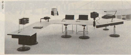
Zwei Arbeitsplätze mit Besprechungstisch und Regalkombination

Organisierte Aktivität sichtbar machen ist die Idee, die dem Büromöbelssystem Greter Primero des Zürcher Innenarchitekten Kurt Greter zugrunde liegt. Das System umfasst verkettbare Arbeitsplätze, Besprechungs- und Konferenztische sowie ein Container- und Regalprogramm. Die