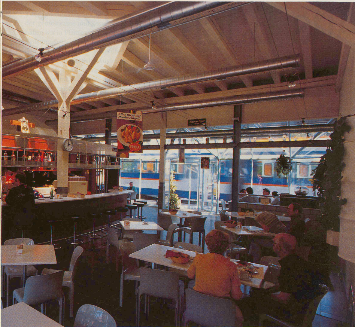
Das traditionelle Bahnhofbuffet: grosszügige Raumdimensionen, offene Passagensituation, Stützen im Raum, freistehende Tische: Buffet Worb/RBS, eröffnet 1987

HANS JÖRG RIEGER IST KUNSTHISTORIKER UND ARBEITET AM INVENTAR DER SCHÜTZENSWERTEN ORTSBILDER DER SCHWEIZ (ISOS). ER LEBT IN ZÜRICH UND UNTERWEGS.