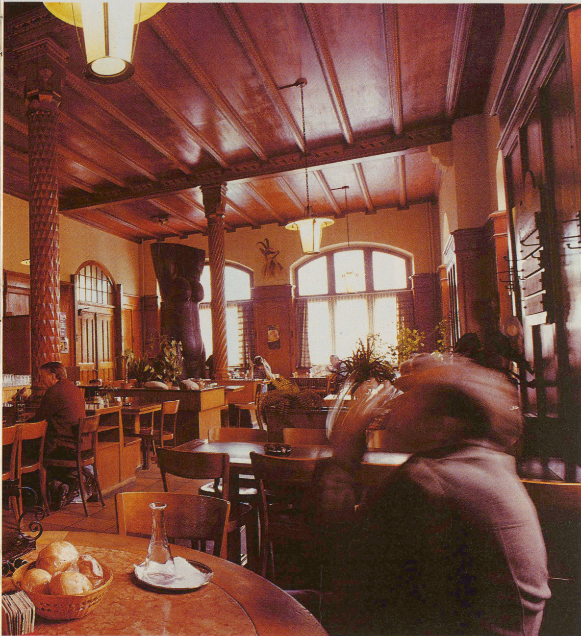
Wo gibt es in unserem Land noch Gaststätten, in denen eine schwarze Venus von Raffael Benazzi Platz findet? Buffet 2. Klasse in Glarus, ein kleines Landesmuseum von 1903.