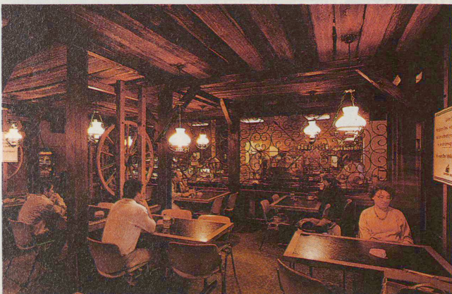
Der zerstörte Raum des Bahnhofbuffets Aarau, 2. Klasse

Arth-Goldau repräsentiert ein Stück Eisenbahngeschichte, und zwar den Boom des ausgehenden 19. Jahrhunderts, als die Bahnhofbuffets ihre erste grosse Blüte erlebten. Zwar waren seit 1855 die ersten Bahnhofrestaurants eröffnet worden (z. B. in Romanshorn, Olten und Basel), doch standen die Buffets vorerst im Schatten der grosszügiger dimensionierten Wartsäle. Erst um die Jahrhundertwende erlebte das Bahnhofbuffet in den Städten, an den Umsteigeorten und Touristenzielen seinen Aufschwung. Nach Krieg