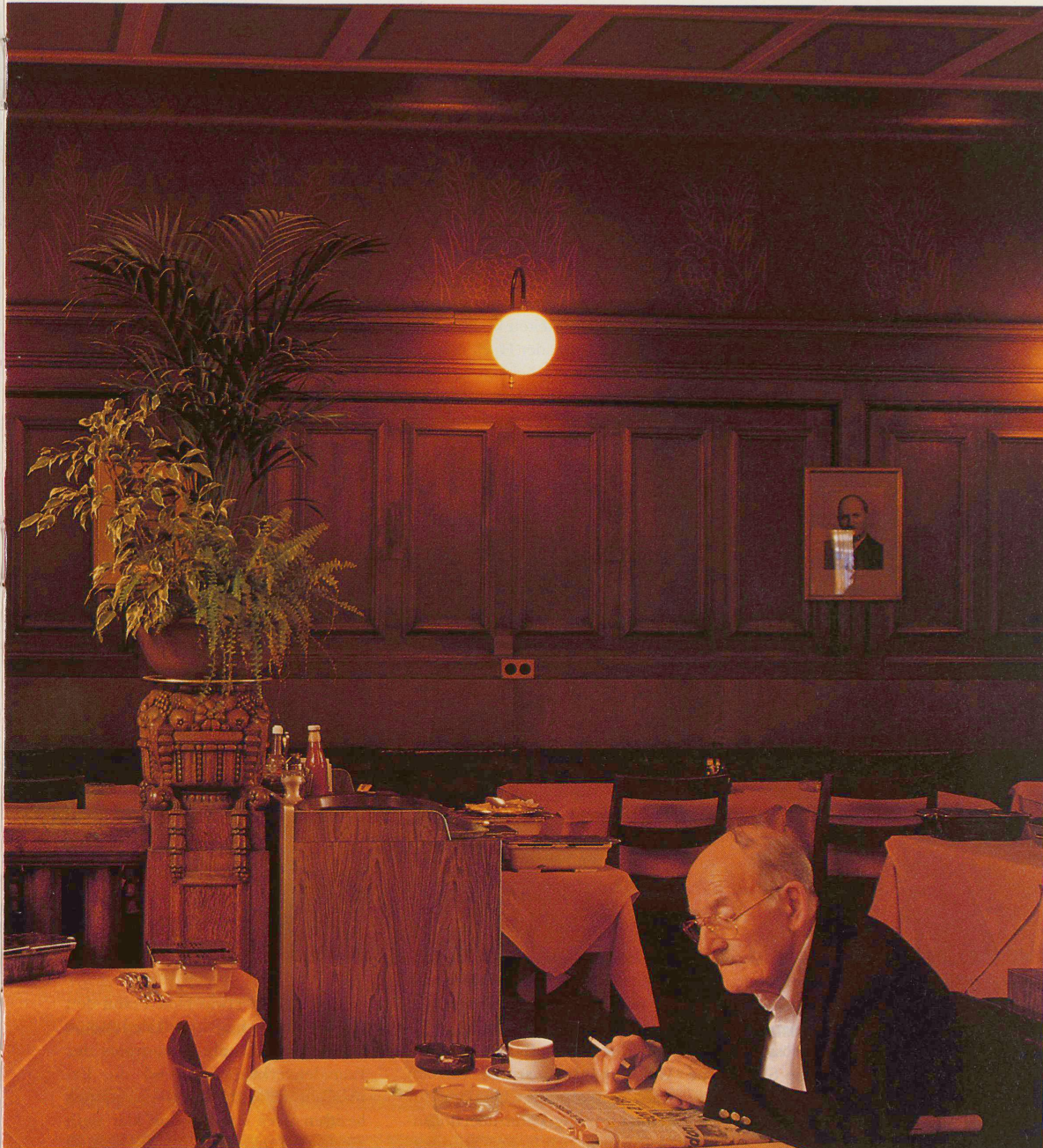
Geborgenheit in der Anonymität bietet nur die Buffetatmosphäre: Lausanne, Buffet 1. Klasse.

ne Restaurant grosszügig erweitern. Es entstand ein Raum von beachtlichen Dimensionen, mit hohem offenem Dachstuhl, durchgehendem Plattenboden und grossen Fensterflächen. Mit seinem optischen Bezug zur Bahn, seinen zwei Stammtischen für Einheimische und Bahnangestellte sowie mit seinem regionaltypischen Holzbausatz besitzt es alle Merkmale eines ländlichen Bahnhofbuffets (einziger Mangel: der fehlende zweite Zugang vom Perron her).