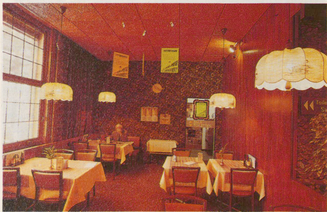
Heimelige Stube mit blinden Fenstern: Buffet Aarau, 1. Klasse

Das Buffet selbst kann diese Entwicklung, deren Wurzeln ganz anderswo liegen, nicht aufhalten. Eine wirkliche Überlebenschance hat es aber nur dann, wenn es – mit dem Bahnhofkiosk, dem Telefon für Auslandsgespräche usw. – seine Funktion als öffentlicher Bezugspunkt der Region bewahren kann: räumlich, zeitlich und sozial. Öffentliche Räume, zurzeit als Urbanismuskonzeption gross in Mode, dürfen sich nicht auf den grossstädtischen Kontext beschränken. ■