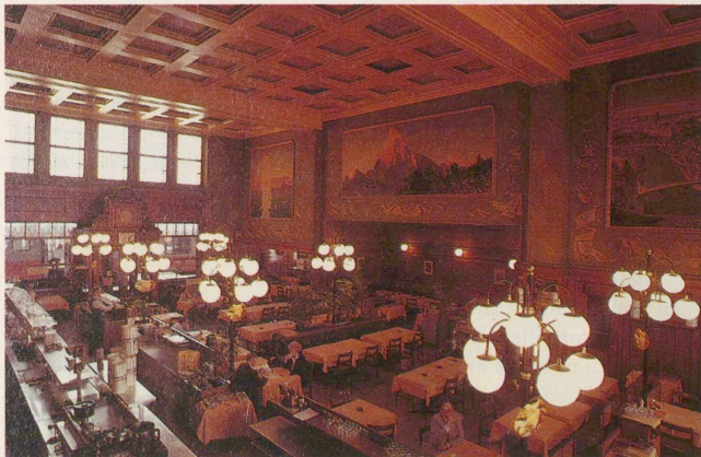
Erstklassbuffet in Lausanne: 1916 eröffnet, 1977 renoviert

Grosses Verständnis für das Wesen der Bahnhofbuffets verraten die Neubauten von Sedrun und Worb. In Sedrun liessen 1985 die Furka-Oberalp-Bahn und Buffetpächter Vigeli Cavagnn nach eigenen Plänen das zu klei-