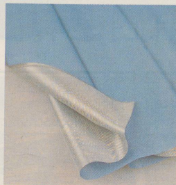
Der neue Vorhangstoff Metalon aus aluminiumbeschichtetem Polyester reflektiert Licht und Wärme.

Lübke Möbelwerke GmbH & Co. KG, Rheda (BRD)