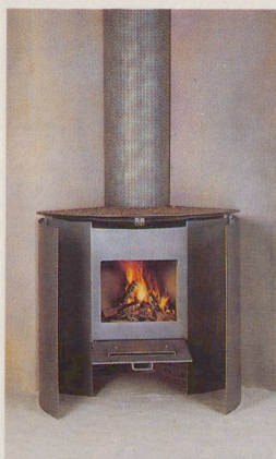
Matten-Cheminéeöfen: Modell Viertelkreis vor Ecke

Das neueste Modell auf dem Bild fügt sich im geschlossenen Zustand harmonisch in den Wandverlauf und verbirgt so seine Funktion. In der gewölbten Schale kann beispielsweise Sand liegen; die Wölbung versinnbildlicht den Weg der aufsteigenden Warmluft. Die Verkleidung des Rauchrohres aus Lochblech lässt sich der jeweiligen Raumhöhe anpassen.