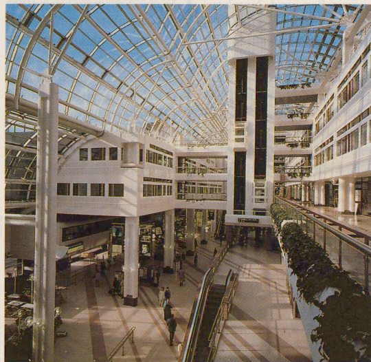
HB-Südwest in Stockholm: Kommerz oder Kultur?

Im Erdgeschoss liegen die verlängerten Perrons des alten Stockholmer Hauptbahnhofs und der neue grosse Wartesaal. Zwei Gruppen von Rolltreppen führen nach oben in die erste Etage, wo sich die Ein- und Ausfahrten befinden. Die Hauptstrasse Kungsgata ist mit einer Rampe auf die Höhe des ersten Geschosses geführt worden. Hier sind ausserdem ein Reisebüro, ein Café, eine Bank, kleine Läden, eine Garage mit 300 Parkplätzen und die Hausmeisterlogen zur Kontrolle der WTC-Eingänge untergebracht. Die von der Stadtverwaltung geplante Totalüberbauung der gesamten Geleisanlagen mit Hotels, Bürohäusern und Wohnungen passt vielen Stockholmern nicht. Sie hätten lieber ein Kulturzentrum mit Theatern, Konzertsälen und Parkanlagen bei ihrem Bahnhof. EZ