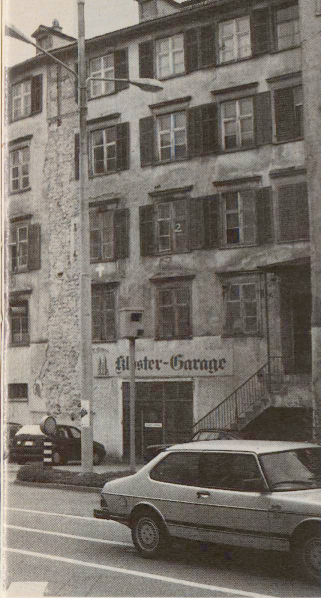
Die Moosburg (Bild links) bleibt stehen, die heutige Polizeigarage (im Bild rechts) wird durch einen Calatrava-Bau ersetzt. Auch die beiden Nachbargebäude werden für die Polizei renoviert.

Auch dieses Haus, ausgestattet mit einem aussergewöhnlichen Treppenhaus, soll zum Polizeiquartier werden. Wenn dies alles realisiert ist – so träumt St. Gallens Kantonsbaumeister Arnold Bamert –, könnte man das heutige Polizeihauptquartier wieder im alten Glanz erstrahlen lassen: Wo heute die Einsatzzentrale und die Fahndungsbüros aufeinanderkleben, in diesem einstigen Ökonomiegebäude des Klosters, hatte nämlich auch St. Gallens erstes Stadttheater gespielt. RH