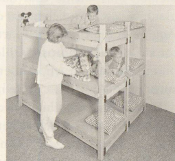
Mehrzweckhurde für Kind und Kegel, schockgeprüft

risch wird? Die Stadt Zürich hat im Hinblick auf 1995 bereits jetzt in Oerlikon eine Beratungsausstellung mit Liegestellen und Notaborten eingerichtet. Dort bekommt man zweifellos auch Antwort auf die Fragen nach dem Wie und Wohin mit dem Was im Ernstfall. Falls sich solche Fragen dann überhaupt noch stellen. Und das wiederum ist genau die Frage, die man nicht zu stellen hat. HP