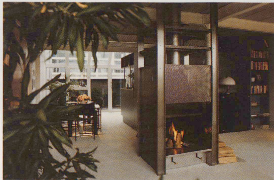
Eine Gestaltungsvariante für ein Einbaucheminée (Design: ARB Architektenteam, Bern)

trolle lässt sich stufenlos einstellen und schliesst im Nichtbetriebszustand absolut dicht. Das Programm besteht aus vierzehn Einbau- und freistehenden Modellen: Standard, über Eck oder dreiseitig offen. Alle Modelle gibt es mit Glasscheiben und auf Wunsch mit Ventilator, Warmwassereinsatz usw. Die einfache Montage ermöglicht es dem Bauherrn, sein Cheminée selbst und damit kostengünstig einzubauen.