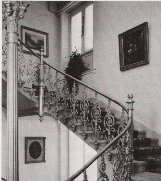
Halle und Haupttreppe im Grand Hotel Kronenhof in Pontresina. Die Deckenmalereien in der Halle sind 1901 entstanden und stammen vom Berner Otto Haberer.