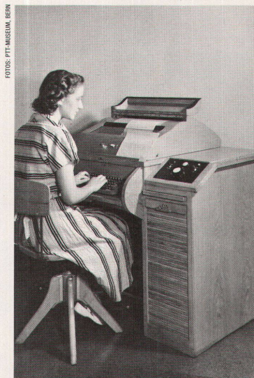
Telegraf und Telex in verschiedenen Entwicklungsstufen: zwischen 1925 und 1937 (links), 1950, 1957, 1962, 1969 (von oben nach unten)