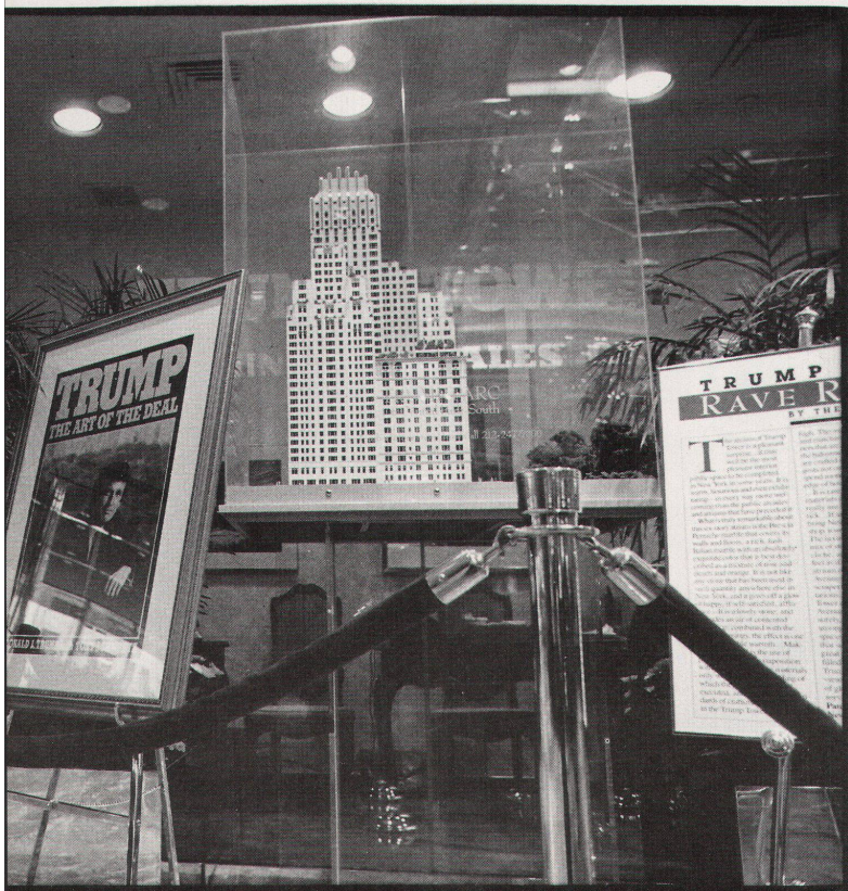
Das grosse T ist allgegenwärtig im Atrium von Trump-Tower. Mehr als ein Markenzeichen: ein Statussymbol, wie etwa der Stern von M.

Im Unterschied zu gewissen Baulöwen bewegt sich Trump, mit der Hilfe erstklassiger Anwälte, innerhalb der Legalitätsgrenze. Er weiss nicht nur die Möglichkeiten des Zulässigen auszunutzen, sondern macht Gesetzesnischen und -lücken ausfindig. So hat er für sein Projekt «Trump City» gefordert, dass die theoretischen Bebauungsrechte jener Grundstücksteile, die im Hudsonfluss liegen, auf das bebaubare Festland übertragen werden. Mit diesem Schachzug könnte er ein Viertel zusätzlicher Ausnutzung ins trockene ziehen und das ohnehin schon klotzige Projekt noch beträchtlich verdichten. Würde diesem Begehren stattgegeben, entstünde für die knapp 1000 km Ufer in New York City eine