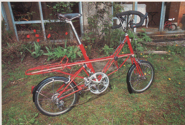
Seine Form verunsichert – und trotzdem hat es schon seine überzeugte kleine Fangemeinde: das Moulton-Bike.

Vom gleichen Autor, gleichen Verleger und mit der gleichen Sorgfalt, aber nicht in der Mappe enthalten: «Schweizer Städtebauer bei den Sowjets». Hans Schmidt und Hannes Meyer nehmen darin zu ihrer Arbeit Stellung. Fr. 9.80.