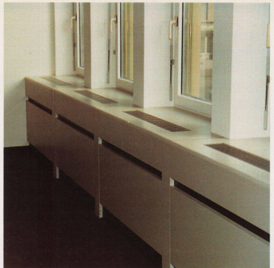
Ganzheitliches Konzept für Innenbrüstungen: Planung, Fertigung und Montage werden von einem Hersteller realisiert.

Die Pflanzenwelt Asiens stand für die neue Kollektion von Jack Lenor Larsen Modell.