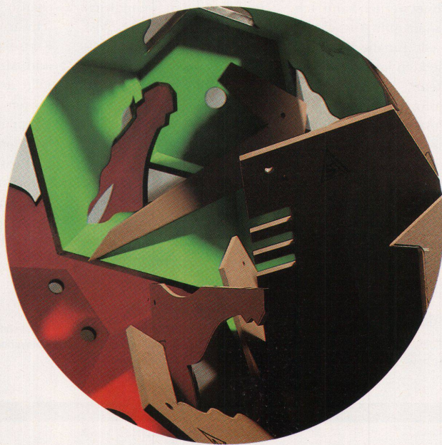
Hannes Wettsteins Spider: Experimentieren mit Holz