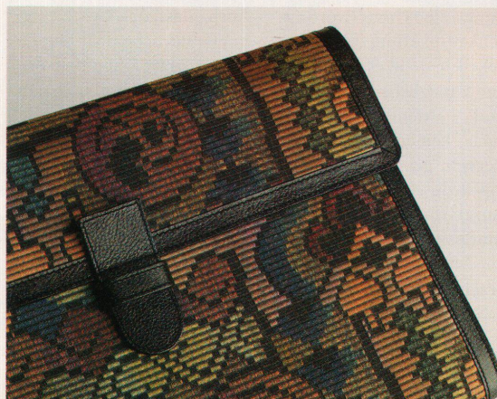
Dokumentenmappe aus der neuen Fischbacher-Kollektion

Frau von heute». Die Linie umfasst acht Gepäckstücke, vom Attaché-case zur Dokumentenmappe und vom Beauty-case zur Reisetasche. Die Artikel sind aus Stoff, haben eine Ledereinfassung und verfügen, je nach ihrer Bestimmung, über eine Anhängetickette.