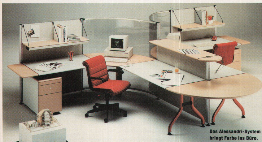
Das Alessandri-System bringt Farbe ins Büro.