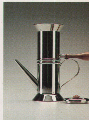
Weitere Prototypen von Dalisi und das Endprodukt (ganz rechts), das in die Serienproduktion aufgenommen wurde.

meisten kopierten Waren der Firma. Oder das Servierbrett «King-Kong», entworfen von einem Trio ohne Industrieerfahrung und ohne Namen. Versuchslabors, wie sie Alessi betreibt, sind auch in der italienischen Möbelindustrie im Aufbau. Gesucht sind Nischen und Auswege aus den überfüllten Regalen. Wohn- und Haushaltwaren sollen neu definiert werden. So entstehen neue Warenangebote, die Probleme lösen wollen, die noch gar niemand hat. Die einen reden von «echten Bedürfnissen und kulturellem Wandel», die ändern von verstopften Märkten, verzweifelter Konkurrenz in einer satten Warenwelt und beschleunigter Zirkulation.