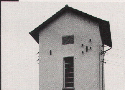
Biel (Sägerei Renfer), Ins Oberdorf, Särwil (von oben nach unten)

«Rapunzel, Rapunzel, lass dein Haar herunter!» Der Königssohn muss dreimal rufen, dann öffnet sich das einsame Fenster unter dem Ziegeldach des gemauerten Turms. Ein goldgelbes Seil aus geflochtenem Frauenhaar fällt vor dem wartenden Prinzen ins Gras. Der junge Mann klettert am langen Zopf vorsichtig ins Turmgemach der Transformatorstation hinauf. Und das Liebespaar beginnt in der hereinbrechenden Dämmerung ein ganzes Dorf mit seiner freigesetzten Energie zu versorgen: Als weithin sichtbares Zeichen brennt bald in jedem Haus des Orts ein Licht.