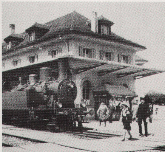
Von den Anfängen der Schiene zu ihrer Zukunft: Veranstaltung am 4.12. (Text rechts)