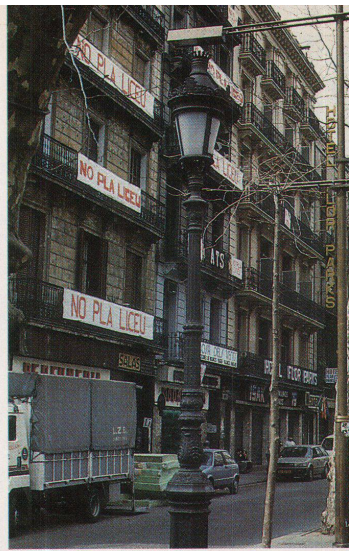
Selten Protest: Bewohner eines Wohnhauses wehren sich.

Auch weltberühmte Architektennamen tauchen rund um Olympia auf: Ricardo Bofill erweitert den Flughafen und auf dem Montjuic das Sportinstitut, Arata Isozaki baute die neue Gymnastikhalle neben das alte, inzwischen erneuerte Stadion, Picornell de Gallego erweitert das Schwimmbad auf dem Berg. In letzter Minute bekam auch noch Santiago Calatrava die Ehre: Die «Telefonica» realisiert seinen 118 Meter hohen Telekommunikationsmast. Der Montjuic-Berg wird so zur Parade grosser Architektennamen – allerdings gegen den Protest der einheimischen Baufachleute. An andern Orten