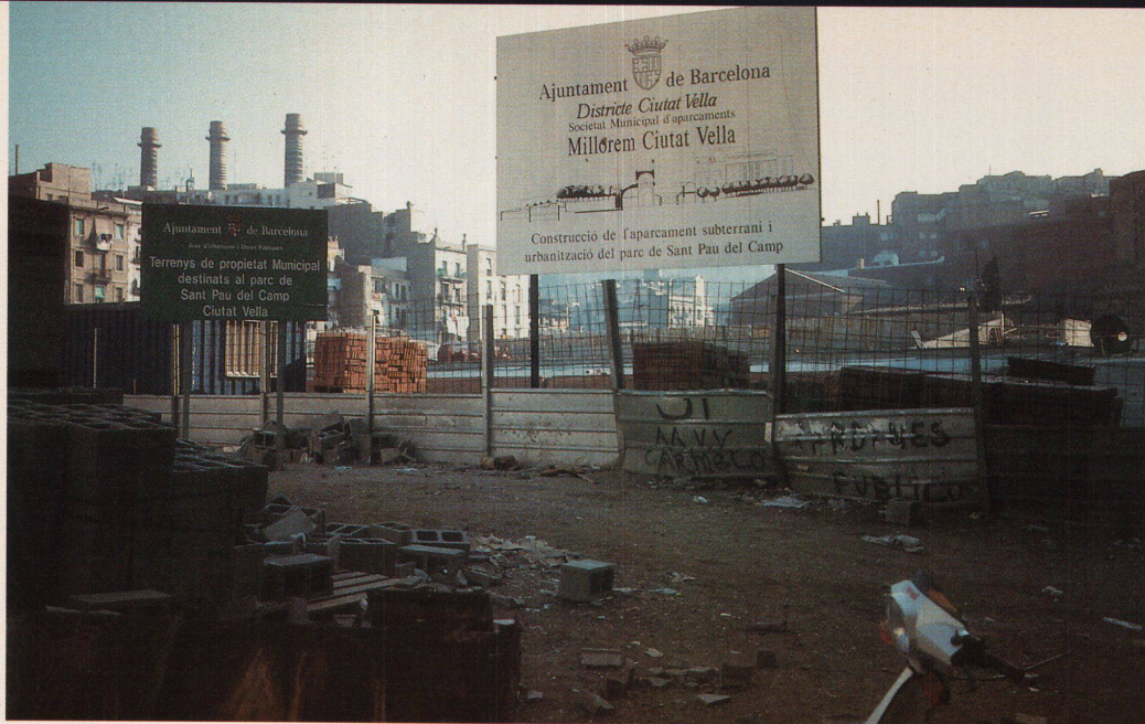
Abbrechen, sanieren, neu bauen: «Verbesserung» der Altstadt

Barcelona auf Neues: Im Poble Nou, dem olympischen Dorf, wo ein Konsortium eben erst mit Bauen begonnen hat, wird auf 47 Hektaren ehemaligem Industrieland das erste dem Meer zugewandte Barceloneser Wohnquartier entstehen: die «Copacabarna» («Bar-na» als Abkürzung für Barcelona). Hier kostet eine mittlere 62-Quadratmeter-Wohnung mindestens 16 Millionen Peseten (220 000 Franken). Die Preisspanne, zwischen 130 000 und 750 000 Franken, ist für Spanien enorm. Wer jetzt kauft, muss 10 Prozent anzahlen. Beim Bezug 1993 müssen 30 Prozent Eigenkapital eingebracht sein, den Rest finanzieren die Banken bei 15 Prozent Hypozins. 1813 Wohnungen werden gebaut, davon will die Stadt 450 günstig weitergeben. 570 der Wohnungen, die erst auf dem Papier existieren, wurden diesen Sommer als erste zum Verkauf angeboten. Fast 2000 Interessenten meldeten sich, doch die Neugier war grösser als die Kaufkraft. Die Golfkrise habe die Kauflust zusätzlich gebremst, bedauert das Konsortium. Bisher gingen nur die teuersten Wohnungen weg und nur die der berühmten Architekten. Prestige auch hier: Wer es sich leisten kann, wohnt dann in einem echten Bofill. Die rund 6000 Bewohner des künftigen Quartiers werden zu den gut situierten gehören. Damit sich der Kreis öffnen kann, hat Jordi Pujol, konservativer Präsident der katalanischen Provinzregierung, einen speziellen Wohnbeihilfenplan vorgestellt.