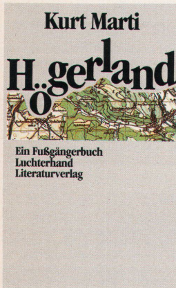
Kurt Marti: «Högerland», ein Fussgängerbuch. Verlag Luchterhand, Frankfurt a. M. 1990, ISBN 3-630-86742-1, Fr. 32,80

«Ein Fussgängerbuch» ist selbstverständlich Pflichtstoff für den Stadtwanderer. Der pensionierte Pfarrer und Schriftsteller Kurt Marti macht Spaziergänge. Alleingelassen mit seinen Gedanken, hat er auch welche und schreibt sie auf. Er erlebt keine Abenteuer auf seinen Gängen, doch scheint ihm die Welt um ihn