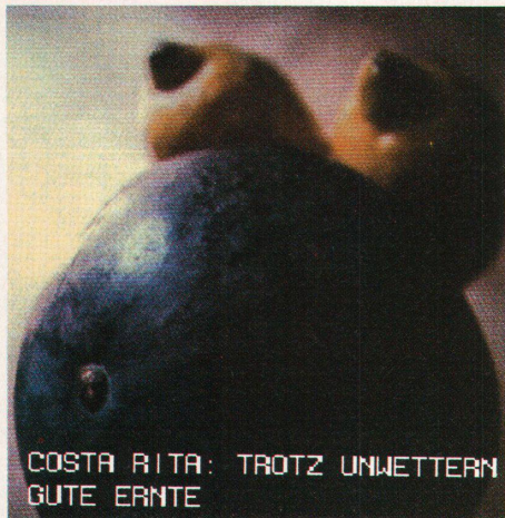
COSTA RITA: TROTZ UNWETTERN GUTE ERNTE