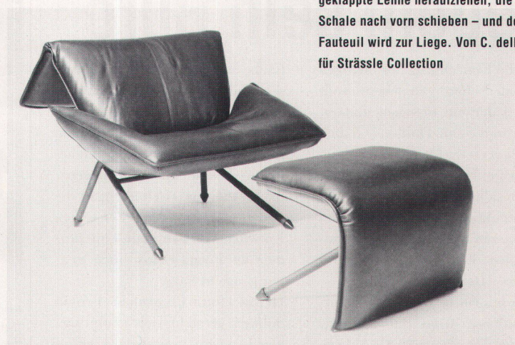
Ein Griff über den Kopf, die heruntergeklappte Lehne heraufziehen, die Schale nach vorn schieben – und der Fauteuil wird zur Liege. Von C. dell'Orso für Strässle Collection