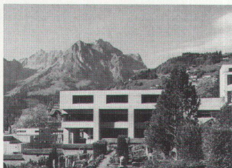
Das Gemeindeschulhaus Engelberg von Ernst Gisel: Ansicht vor der Verschandelung

Der Engelberger Gemeinderat geht mit der Zeit. Darum will er auch dem 1965–67 entstandenen Schulhaus, das zu den wichtigen Bauten Ernst Gisels gehört, eine Schlafmütze überziehen. «Verbesserung des äusseren Erscheinungsbildes sowie Integration in die Landschaft» ist eines der Sanierungsziele. Die Kuster + Infanger Architekten AG aus Engelberg zeigt uns