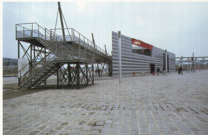
Parc de la Villette bei Tag (oben) und bei Nacht – eine Fülle architektonischer Inszenierungen begleiten die Verbindungsachsen