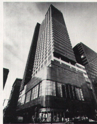
Der Wolkenkratzer für die Pennsylvania Saving Found Society in Philadelphia von William Lescaze (1929)

Aus Genf ist der Architekt William Lescaze vor 70 Jahren nach Amerika ausgewandert. Dort hat