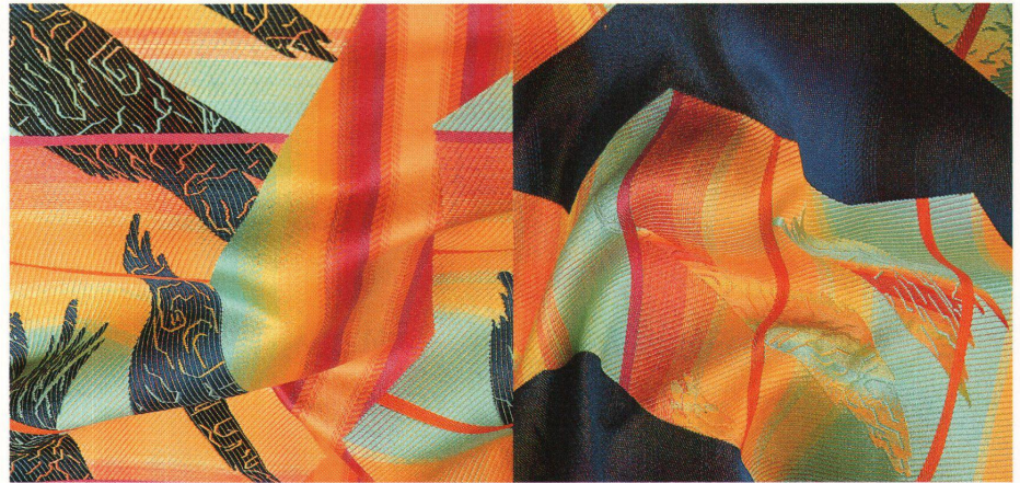
Projekt: Jaquard One, Jaquard Two Design: Patricia Kinsella, Prato (I) / Müller-Zell, Zell Oberfranken (D)