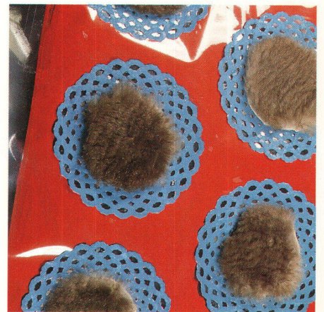
Projekt: Fantastischer Stoff Design: Verena Rüegg, Zürich