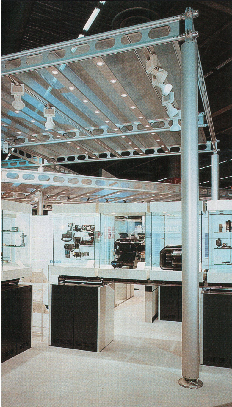
Das System 8.0 für Messestände, realisiert für die deutsche Firma Expotechnik. Ebenen wie Träger, Displays, Möbel und Paneele können flexibel gruppiert werden. Siemens stellt sich an Messen im Nose-Design vor (oben). Die Arbeit reicht vom Konzept bis zum Detail, z. B. zu den Steck- und Verbindungselementen (unten)

zelle MTS 1.0 für die deutsche Firma Schiederwerk. Sie ist sowohl freistehend wie als Wandversion geeignet und kann Zusatzelemente nach Wahl (Hocker, Tablar, Zusatzgeräte etc.) aufnehmen. Hier betreuen die drei Designer die Entwicklung vom Entwurf bis zur Serienreife.