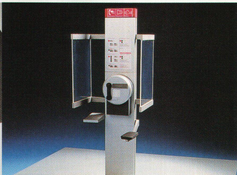
Nose im Telekommunikationsgeschäft: Zerlegbare Ordner für die deutsche Telekom (links). Das öffentliche Telefon MTS 1.0 mit Sitzplatz für die deutsche Firma Schiederwerk

orientiertem Arbeiten, Menschlichkeit und Kooperation». Diese sympathische Bestimmung scheint zu funktionieren. Die Mitarbeiterinnen und Mitarbeiter blieben bisher alle mit von der Partie. Mit eher bescheidenen 150 000 Franken Aktienkapital starteten die drei Partner 1991 ihr Unternehmen. Sie selber zahlen die Partner einen «guten Grundlohn» aus. Beim Jahresabschluss entscheiden die drei über die Verwendung überschüssiger Mittel als Boni oder Investitionen. Dabei wird darauf geachtet, dass für die schrittweisen Investitionen wenig Fremdkapital eingesetzt werden muss. Zahlen werden keine verraten. Arbeit, so Nose, ist in ihrem Atelier genug vorhanden. Zugute kommen ihnen die guten Beziehungen zu Zintzmeyer & Lux, die vertraglich geregelt sind und zwischen zwanzig und dreissig Prozent des Auftragsvolumens beisteuern. Für die grosse Zürcher Agentur füllen die Abkömmlinge eine Lücke beim 3D-Bereich, so etwa bei 3D-Grafik Design für Telekom. Auch andere Agenturen mit wenig Spezialisierung auf 3D-Aufgaben nutzen die Erfahrung von Nose. Auch das Beziehungsnetz zur Mode- und Werbebranche zahlt sich aus. Punkto Entwicklung der Firma hält bereits der Business-Plan fest, dass «das personelle Wachstum zur Zellteilung des Unternehmens führen soll, sobald ein Profitcenter die Grösse eines gut funktionierenden Teams überschreitet». Diese Grenze wird bei etwa zwölf Mitarbeitern gesehen. Expandieren möchte Alexander Müller am ehesten in ein EU-Land oder in den Fernen Osten.