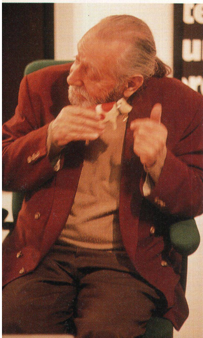
Zu Besuch bei Girsberger, Elan und Zumtobel in Bützberg war Ettore Sottsass. Er freut sich sichtlich an anonymen Schweizer Design z.B. einer Holzkuh vom Heimatwerk