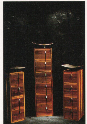
«Veni vidi vici», Schubladenstock aus Zwetschgenholz mit Schale aus Chromstahl