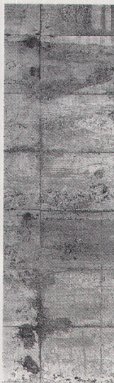
Architekturmuseum in Basel

worden ist, sei murrend in Kauf genommen. Eine Probe aber wird dieser Führer erst bestehen müssen: Wird die Klebebindung den Beanspruchungen des Stadtwanderns gewachsen sein? LR