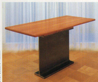
Leuppi Tisch – Birnbaum auf T-Träger