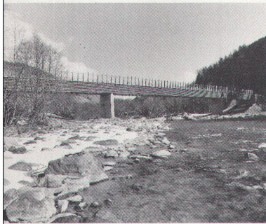
Europäisch ausgezeichnet: Die Holzbrücke über den Inn im Unterengadin