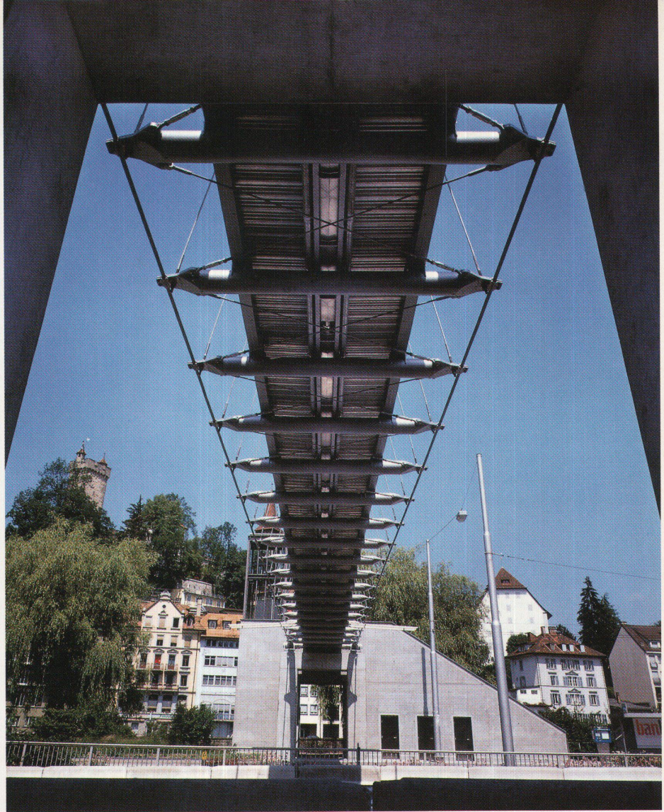
Untersicht der Brücke. Spiralseile der Bogenaussteifung, Hängeseile, Quer- und Längsträger, Beplankung zeigen die Klarheit des Kräftespiels

Eine Brücke entwerfen, heisst ihren Bauvorgang planen. Die stark befah-