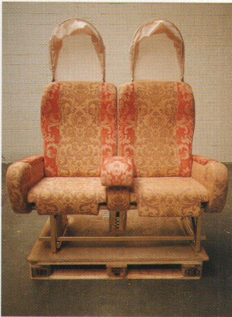
Der Stuhl mit Haube wurde von Matteo Thun und Carlo Canervo umgestaltet