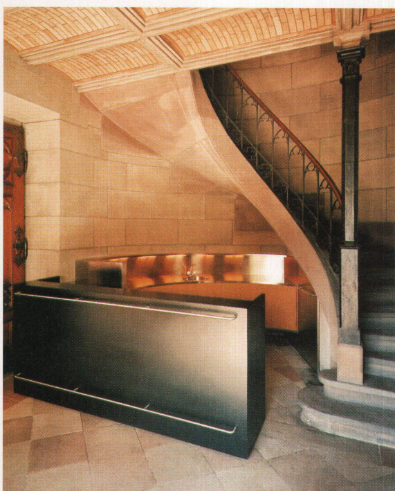
Bilder: Ruedi Walti