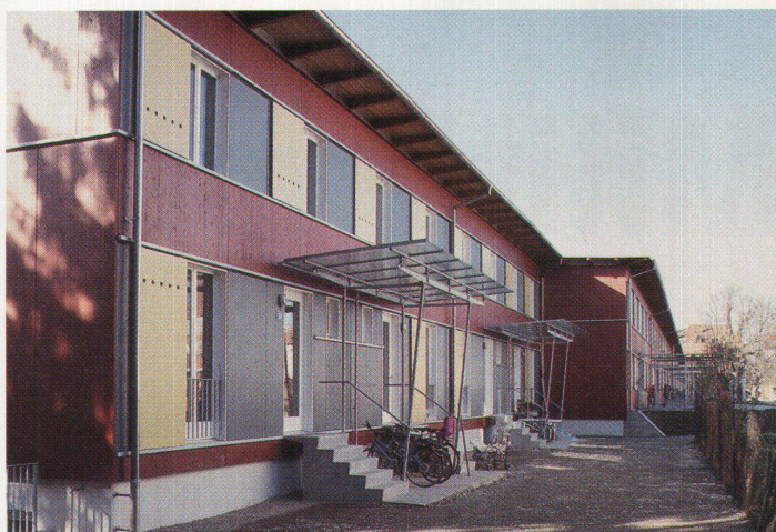
Siedlung Niederholzboden der Metron. Der Raumluft wird die Abwärme entzogen