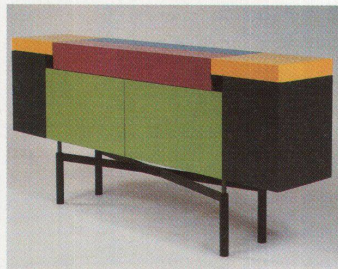
Farbenfroh: Die Kommode C2 aus der ersten Kollektion von Kreis 4