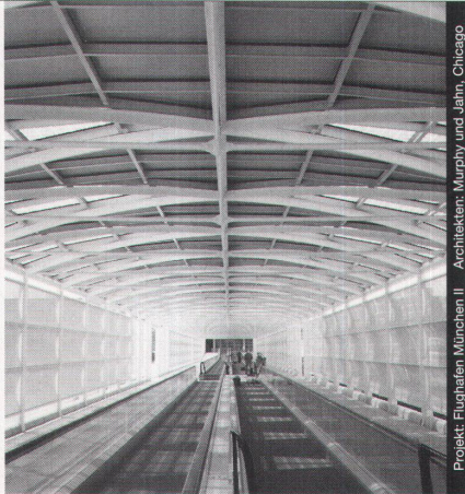
Projekt: Flughafen München II - Architekten: Murphy und Jahn, Chicago

Stahl-Glas-Konstruktionen in architektonisch perfekter Vollendung verwirklichen wir mit innovativen Ideen und höchsten Anforderungen an Materialien und Ausführung.