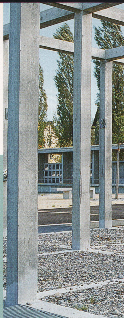
Die Urnenwände treten mit ihren Betonstützen aus der Wasserfläche heraus

Die Erweiterung des Friedhofs in Bern-Bümpliz ist fertiggestellt. Die Architekten Ueli Schweizer und Walter Hunziker schufen mit dem Künstler Schang Hutter einen Ort, der von Leben und Tod erzählt.