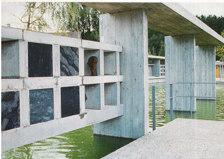
Bilder: Primula Bosshard