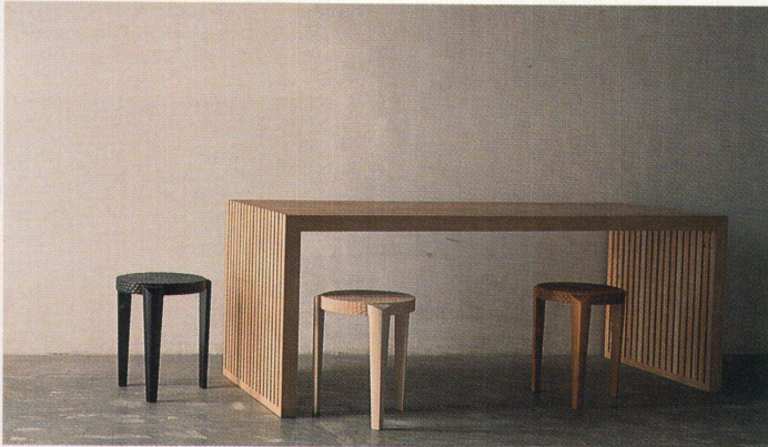
«Bank VI» aus Lärchenholz, hier als Tisch verwendet mit drei verschiedenen Ausführungen des Hockers «Pixie»