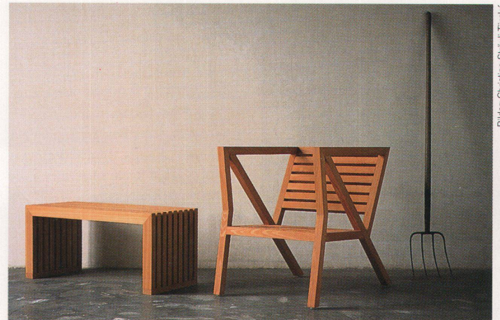
Bilder: Christine Sträuli-Türcké