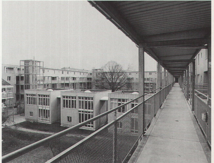
Die Wohnüberbauung Brahmshof in Zürich von Kuhn Fischer Partner